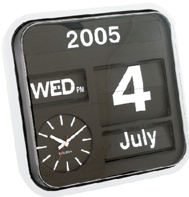
Emploi du temps / Réservation des salles