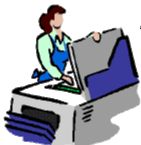
Accueil et Reprographie